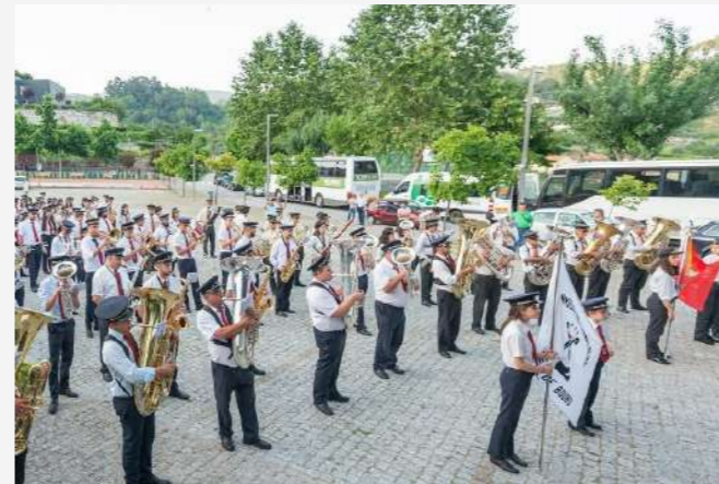
Santa Marinha do Zêzere 2019