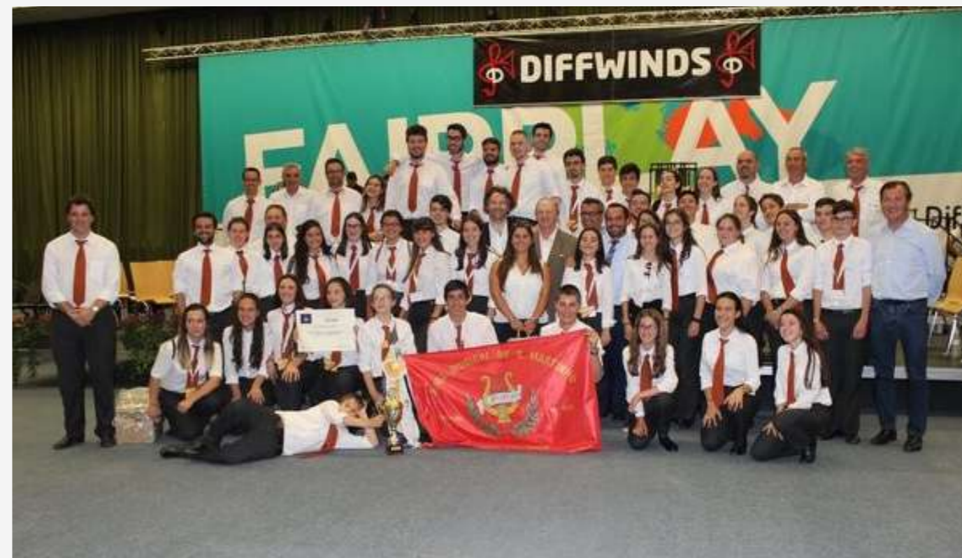
Differdange, Luxemburgo | 2018

Mais recentemente, em 2021, a Banda recebeu o prestigiado maestro português, António Vitorino d'Almeida. Foi um momento de grande aprendizagem e inspiração para todos os músicos, reforçando o compromisso da Banda com a excelência artística.