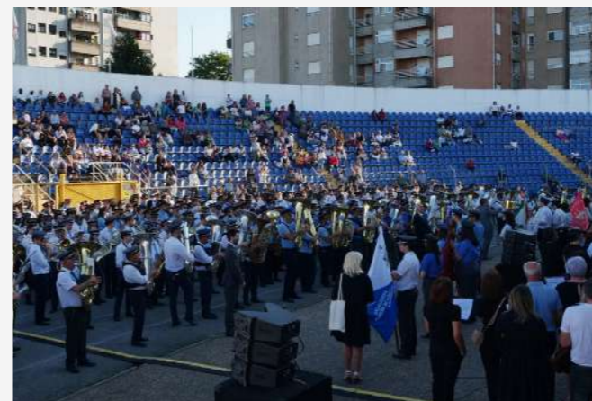
Marco de Canavezes 2023