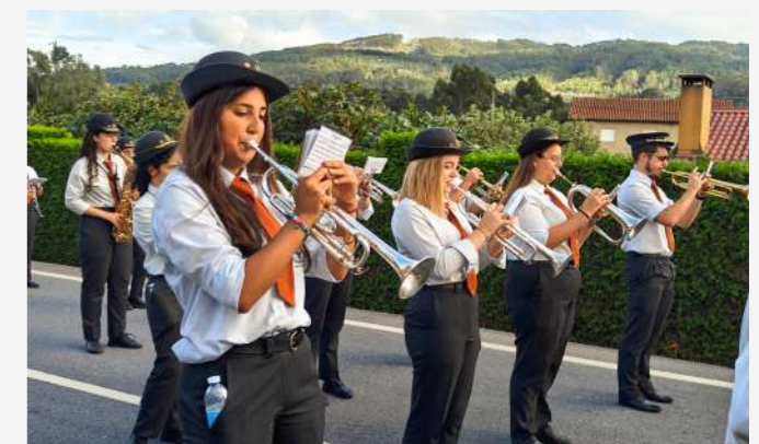
Festa de Santo Ildefonso Porto